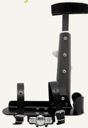
✖ Voetbakje met onderbeensteun