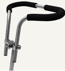
✖ Doorlopend stuur