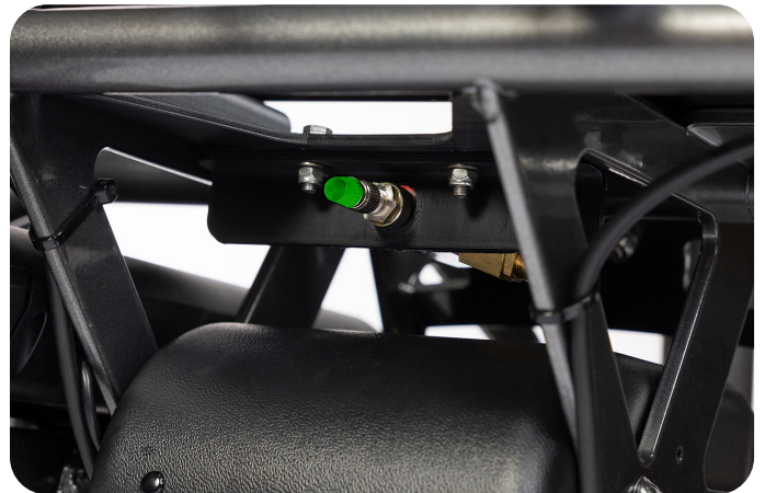
7 Het aanpassen van de luchtdruk kan onder de achterbrug van de fiets.