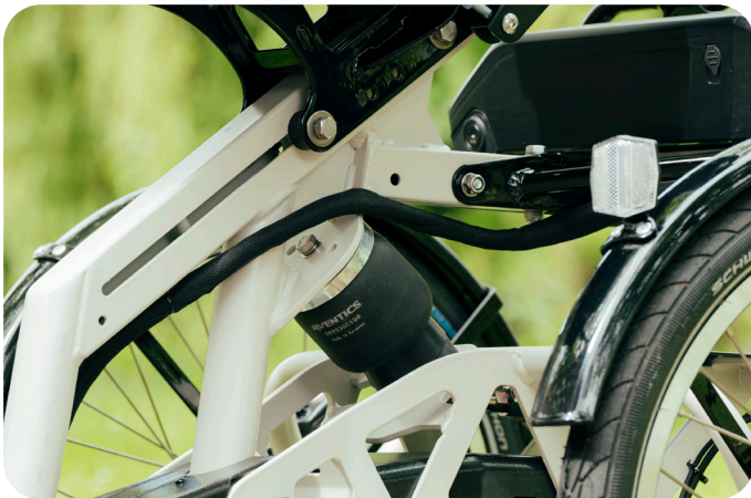
6 De luchtvering bevindt zich tussen de bagagedrager en de stoel.

Let op: We raden aan om uw luchtvering af te laten stellen door uw dealer. Als u tijdens het fietsen merkt dat de stoel bijna tegen de accu komt, betekent dit dat de luchtvering opgepompt moet worden.