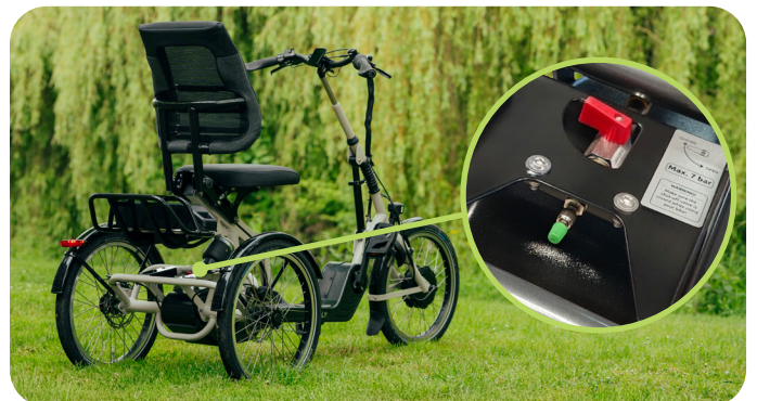
8 De rode hendel bevindt zich aan de bovenkant van de achterbrug