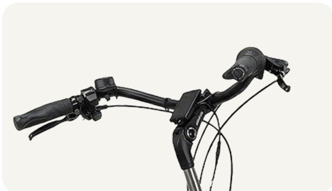
3 Draai de bout los met een inbussleutel

Let op: De veiligheidsmarkering op de stuurpen mag niet zichtbaar zijn als het stuur in de stuurbuis zit (Figuur 4).